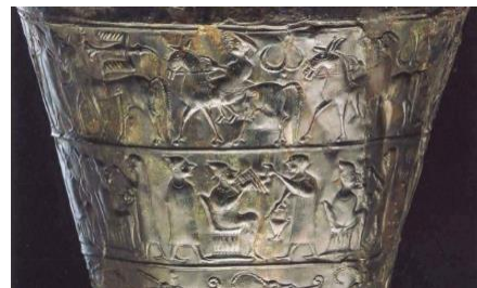
Situla iz Vač

12. Najdbe na slikah pri nalogah 10-11 pričajo o takratnem življenju. Navedite tri dejstva o takratnem življenju, na katera lahko sklepate ob najdbah na slikah pri nalogah 10 in 11. (3 točke)