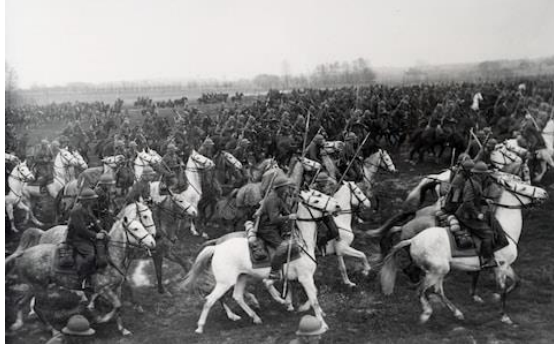
Poljska vojska 1939

a) S pomočjo slik primerjajte tehnično opremljenost poljske in nemške vojske. (1 točka)