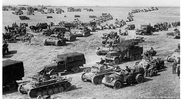
Nemška invazija na Poljsko 1939