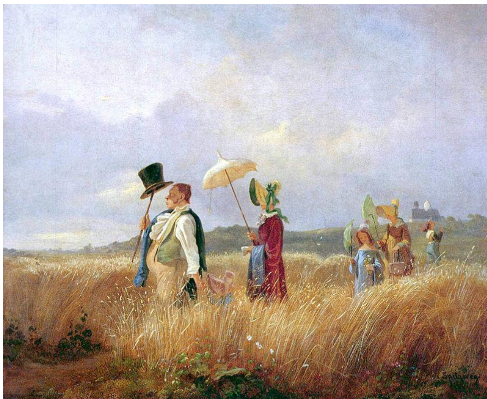
Carl Spitzweg Nedeljski sprehod 1841

11) Oglejte si sliko in odgovorite na vprašanja.